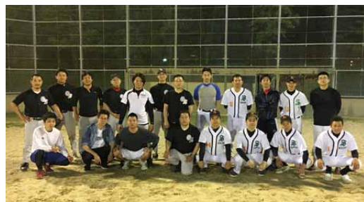
神青野球練習試合