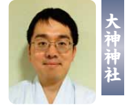
大神神社 よしあき 吉晃 かわかづ 川勝